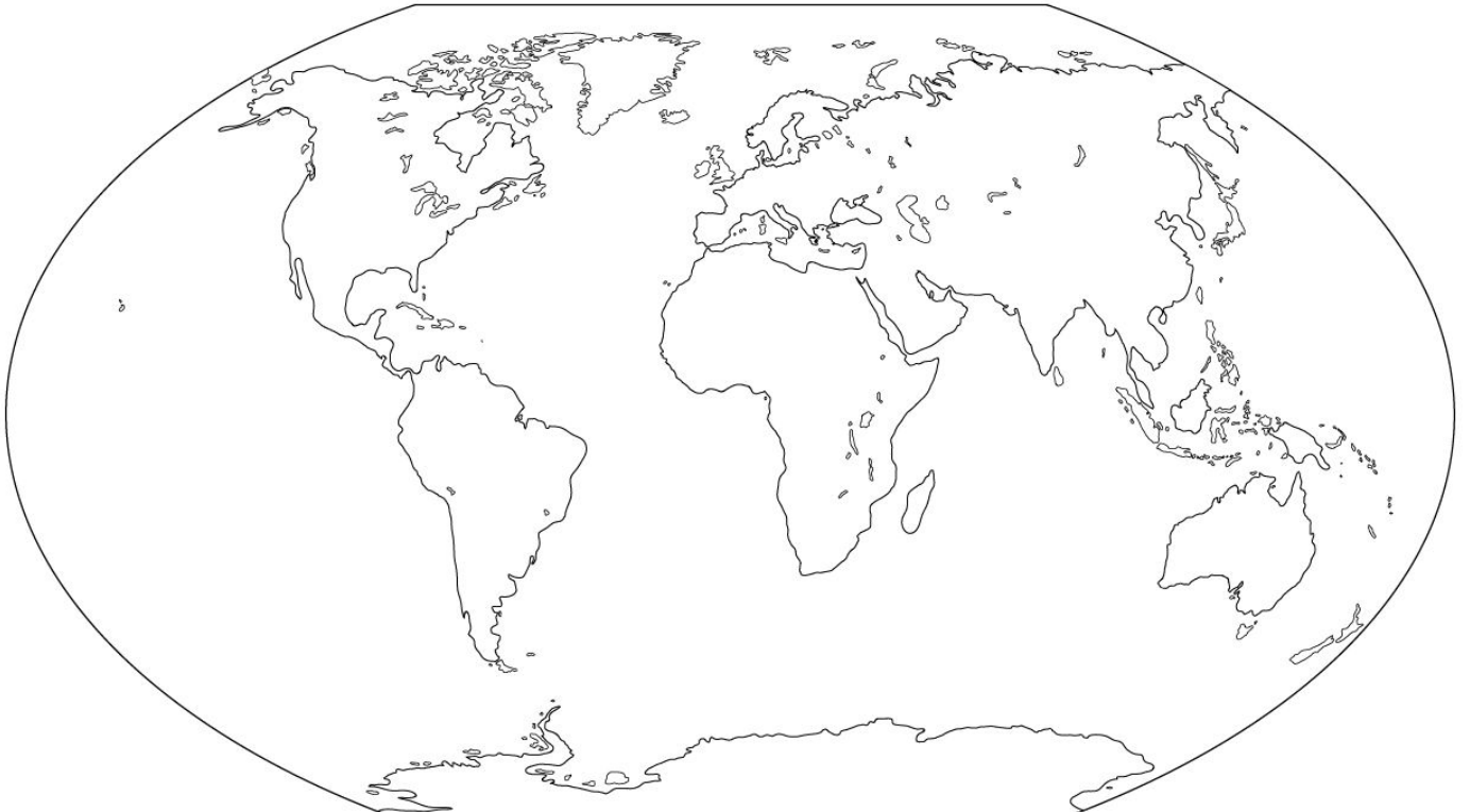
DÜNYA DİLSİZ HARİTASI

3-Dünya haritası üzerinde çok sık nüfuslu alanları X ile, çok seyrek veya az nüfuslu yerleri ise Y ile belirtiniz.